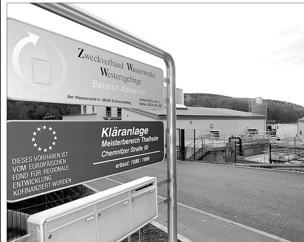
Die 3. Ausbaustufe trägt zur Effizienz und zum Umweltschutz bei.

Der Kostenpunkt des Gesamtprojektes beläuft sich auf 12,97 Mio. € mit einem darin enthaltenen Fördermittelzuschuss von 8,92 Mio. €. Bereits 2009 soll der Rechen und der Sandfang in der Zentralkläranlage Thalheim fertiggestellt werden. Die Baufertigstellung des Gesamtprojektes ist auf Grund der Größe für Jahresmitte 2012 geplant.