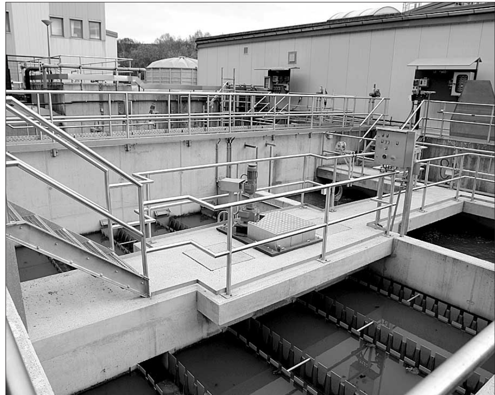
Die Zentralkläranlage in Thalheim vor der Erweiterung.

Hierbei durchläuft das Abwasser zunächst die mechanische Reinigung des Grob- und Feinrechen und des Sandfanges mit seitlichen Fettfangkammern. Anschließend erfolgt die Behandlung des vorgereinigten Abwassers in