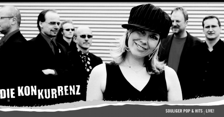
SOULIGER POP & HITS - LIVE!